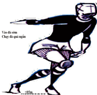
Hình 1. Vào đà sớm, chạy đà quá ngắn

Qua bảng 1 cho thấy: Chúng tôi đã tìm ra được một số sai lầm cơ bản thường mắc từ 80% trở lên đối với SV năm thứ nhất của khóa 53 chuyên ngành bóng chuyền ngành GDTC của Trường Đại học TDTT Bắc Ninh khi thực hiện kỹ thuật đập bóng chính diện theo phương vào đà gồm các sai lầm số 1, 3, 5, 6, 8 và 9. Cụ thể: