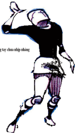
Hình 4. Phối hợp vùng tay khi bật nhảy chưa nhịp nhàng