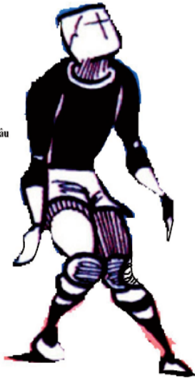
Hình 3. Điểm giậm nhảy sâu, đặt chân ở bước cuối chưa thực hiện ghim đà