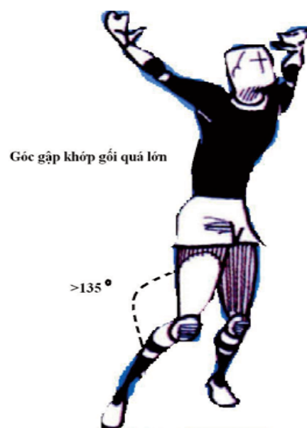
Hình 2. Góc gập của gối (giữa đùi và cẳng chân quá lớn) dẫn đến không nâng được trọng tâm cơ thể lên trên mà bị trôi về trước rất nhiều