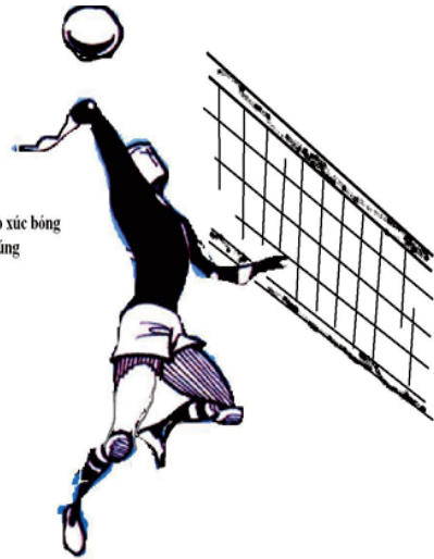
Hình 5. Thời điểm tiếp xúc bóng không đúng (hoặc là quá thấp hoặc là quá sau đầu) dẫn đến khi thực hiện động tác đánh bóng tay bị co