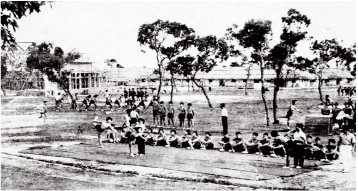
Hình ảnh sân bãi tập luyện của Trường Trung cấp TDTT Trung ương năm 1959

chức, Phòng Giáo vụ, Phòng Hành chính, Quản Trị) và 9 bộ môn (Thể dục; Điền kinh; Bơi lội; Bóng đá; Bóng chuyền; Bóng rổ; Chính trị và Lý luận; Ngoại ngữ, Phiên dịch và Bộ môn Y sinh). Đội ngũ cán bộ, giảng viên gồm 58 người, trong đó có 4 chuyên gia Liên Xô.