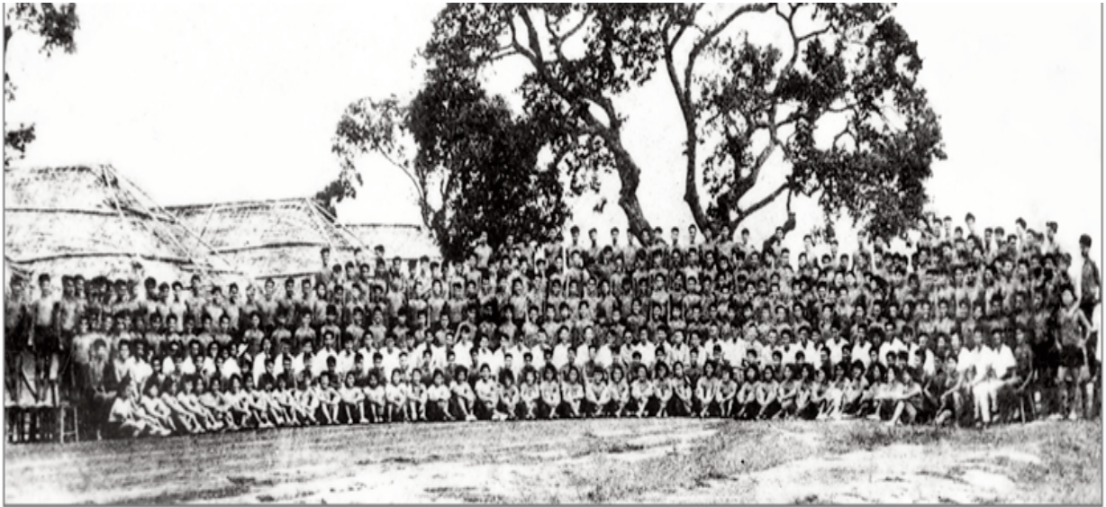
Hình ảnh Trung cấp TĐTT Khóa 1 tại Lễ tốt nghiệp (30/7/1963)

toàn thể cán bộ, giáo viên, công nhân viên và 400 học sinh khóa đầu tiên của Nhà trường. Trong lễ khai giảng, Chủ nhiệm Ủy ban TĐTT Hoàng Văn Thái phát biểu khen ngợi sự cố gắng vượt bậc của Nhà trường đã chuẩn bị rất tốt về mọi mặt, mong Nhà trường bước vào triển khai nhiệm vụ giảng dạy cho thật tốt, phát động thi đua “ba tốt” là: Dạy tốt, Học tốt và cả Phục vụ cũng phải thật tốt. Sự kiện là mốc son đánh dấu sự ra đời cái nôi đào tạo cán bộ TĐTT phục vụ công cuộc xây dựng và bảo vệ Tổ quốc, mở ra chặng đường xây dựng và phát triển của Nhà trường, đóng góp vào sự nghiệp TĐTT của đất nước.