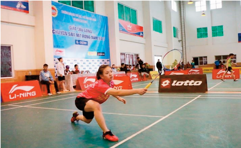
Cầu lông là môn thể thao được đông đảo học sinh trong trường học các cấp yêu thích tập luyện và được phát triển mạnh mẽ trong các trường học trên địa bàn tỉnh Tuyên Quang (Ảnh minh họa)

tập luyện Cầu lông, tương ứng với số lượng gần 50% số học sinh tập luyện Cầu lông tập luyện thường xuyên. Tuy nhiên, vẫn còn gần 20% số học sinh có động cơ tập luyện không bền vững dẫn tới không tập luyện cầu lông ngoại khóa thường xuyên như tập luyện do bạn bè lôi kéo, tập luyện để bớt thời gian rảnh rỗi. Thể hiện bản thân là đỉnh cao của nhu cầu, không thể xếp vào động cơ không bền vững hay thiếu tích cực. Với những nhóm đối tượng này cần có các giải pháp phù hợp biến động cơ tập luyện Cầu lông ngoại khóa của học sinh thành động cơ bền vững.