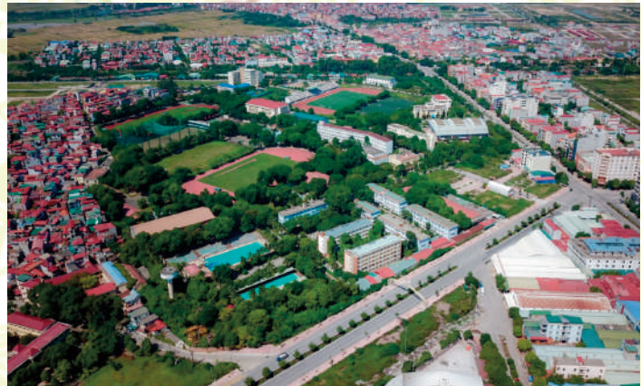
Trường Đại học TDTT Bắc Ninh - “Môi trường xanh hun đúc quyết tâm”

Triết lý giáo dục: Kiến tạo con đường thông minh để mỗi người sau quá trình đào tạo trở thành công dân tốt, phát huy tốt nhất năng lực của bản thân, mang lại giá trị cao cho cộng đồng.