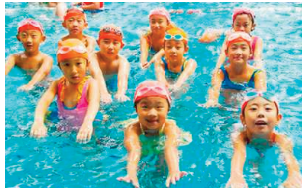
Thể dục thể thao hiện đã phát triển rộng khắp tới mọi đối tượng quần chúng nhân dân và trở thành một phần đời sống tinh thần của người dân (Ảnh minh họa)

một thế giới hòa bình và tốt đẹp hơn thông qua thể thao và lý tưởng Olympic". Tại diễn đàn này Tổng cục trưởng Tổng cục TDTT nước ta đã được mời phát biểu về đường lối quan điểm phát triển TDTT nước ta trước các đại diện thành viên của các quốc gia tham dự.