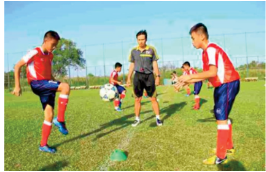
Đào tạo bóng đá trẻ tại Việt Nam hiện cũng đang được chú trọng đầu tư (Ảnh minh họa)

hay U18 / U19: 24 người chơi (bao gồm cả thủ môn) cho mỗi đội; U23 (tùy chọn) 22 cầu thủ (bao gồm cả thủ môn). DFL cũng quy định rõ, tối thiểu 12 cầu thủ gốc Đức được yêu cầu thi đấu ở lứa tuổi U16-U19.