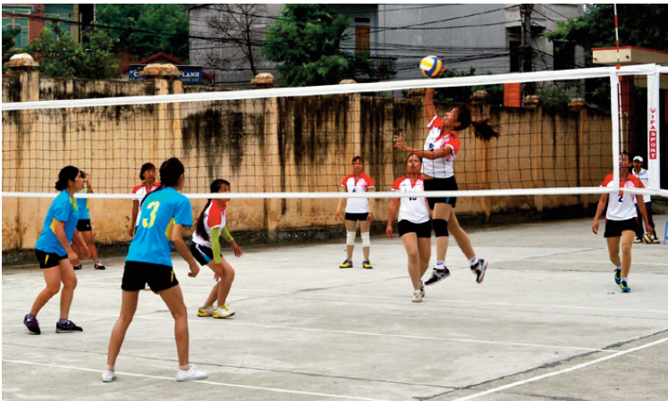
Phong trào TDTT quần chúng phát triển rất mạnh mẽ trên địa bàn Thị xã Từ Sơn, Tỉnh Bắc Ninh

đề cần phải suy nghĩ, sửa đổi vì muốn phát triển TDTT rộng khắp thì không thể thiếu được vai trò của các tổ chức đoàn thể xã hội này.