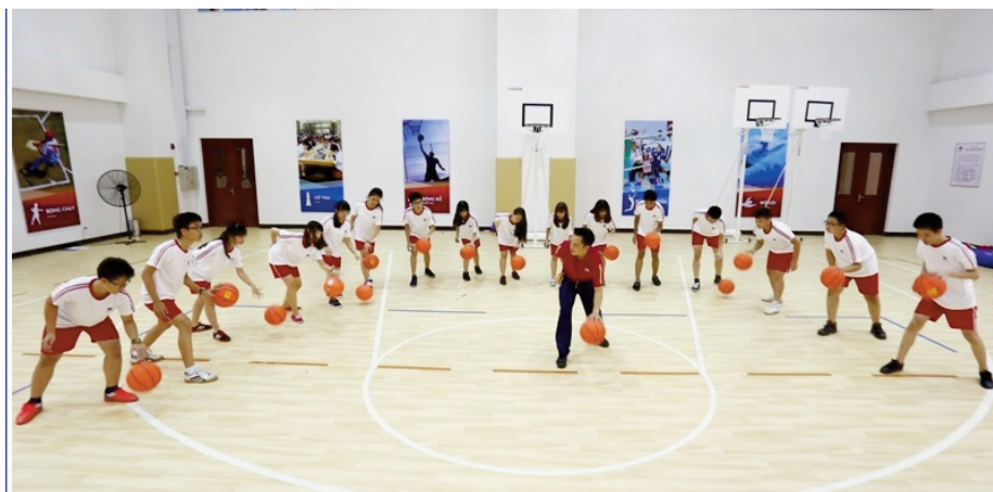
Điều kiện làm việc tốt là một trong những yếu tố kích thích động cơ học tập của sinh viên Trường Đại học TDTT Bắc Ninh