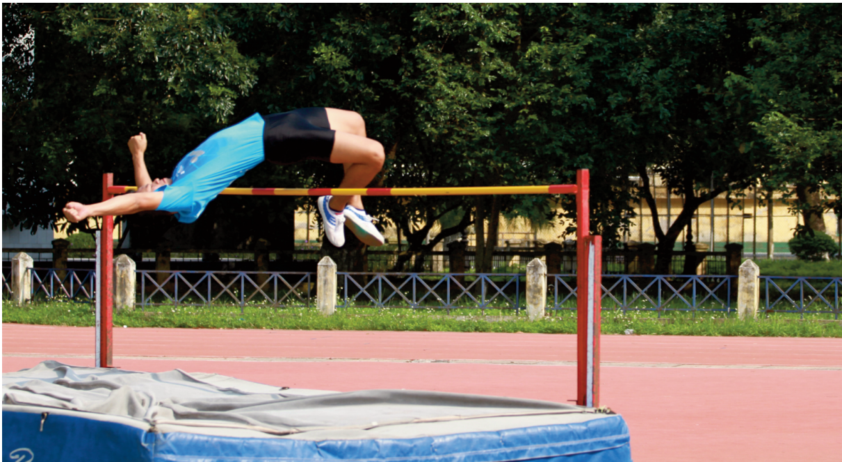
Tăng cường công tác xã hội hóa trong đầu tư cơ sở vật chất phục vụ công tác GDTC trong trường học các cấp là giải pháp quan trọng trong nâng cao chất lượng GDTC trong trường Đại học Nông Lâm, Đại học Huế

học tập, trao đổi và chia sẻ kinh nghiệm với đồng nghiệp.