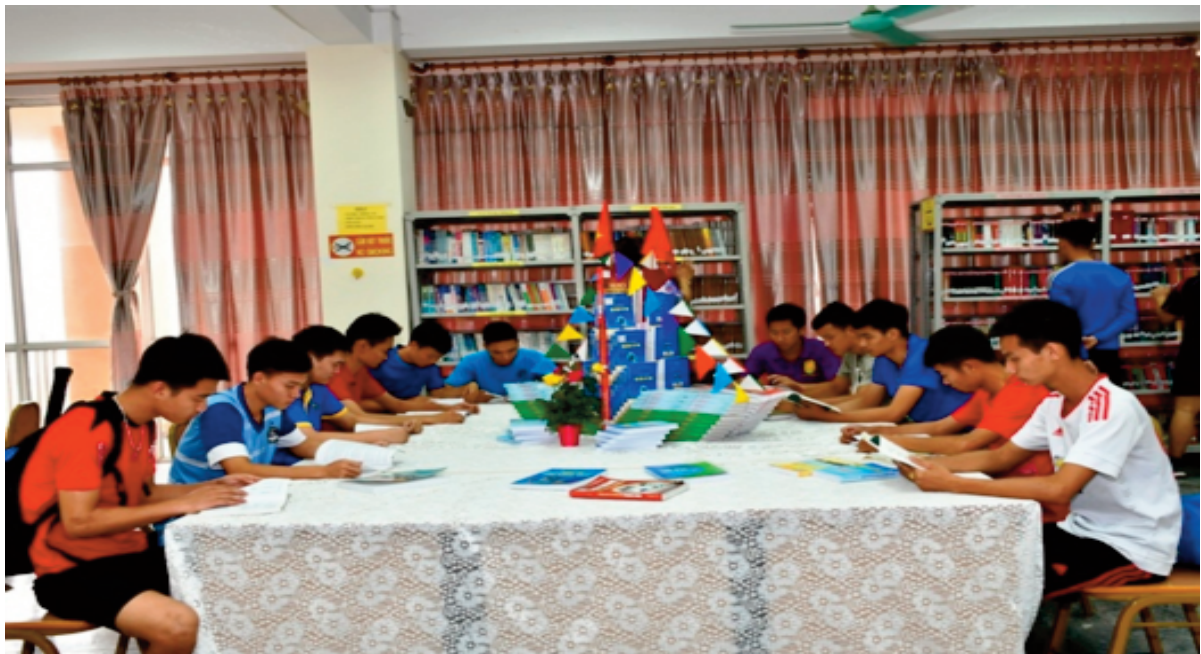
Trường Đại học TDTT Bắc Ninh đã tạo điều kiện tốt nhất để sinh viên tiếp cận nguồn tài liệu Thư viện và sử dụng chúng một cách hiệu quả