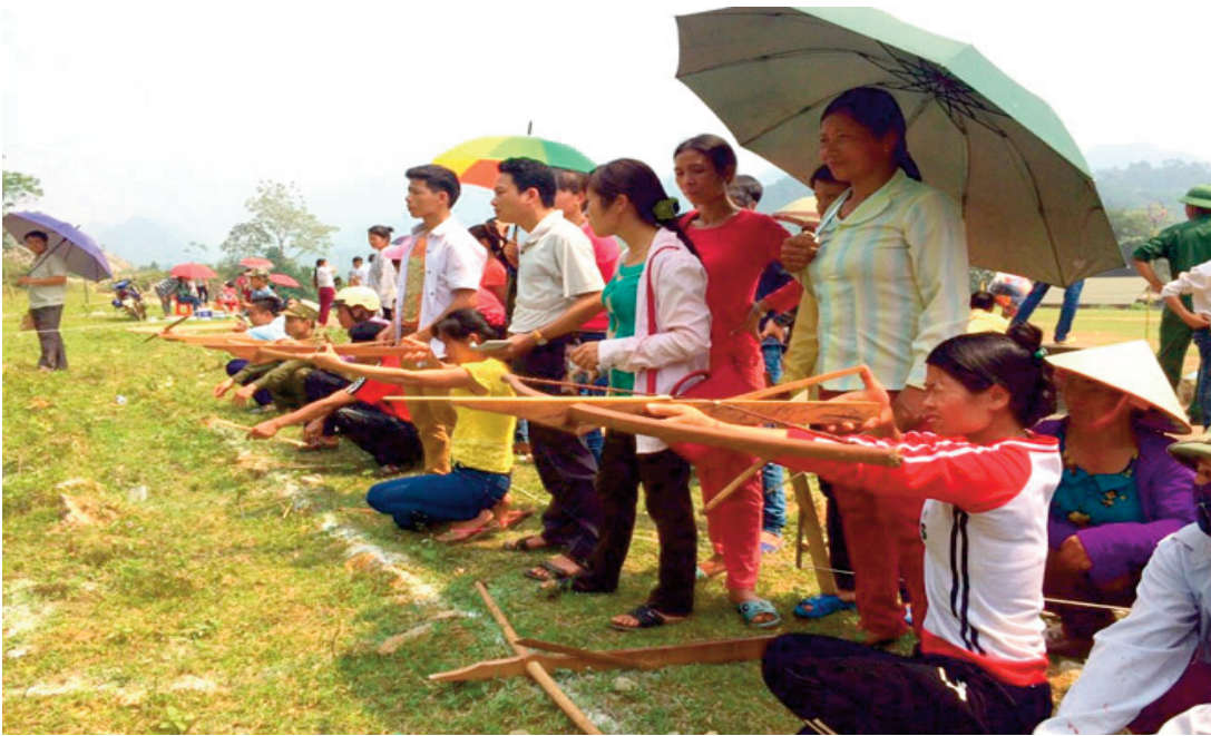
Với đặc thù là nơi tập trung nhiều dân tộc thiểu số, việc phát triển phong trào TDTT Quần chúng tại khu vực miền núi cần được gắn liền với việc phát triển các môn thể thao dân tộc

tiến hành theo mô hình có can thiệp, tức là phụ thuộc chủ yếu vào các chính sách phát triển TDTT của Đảng, Nhà nước và chính quyền các cấp. Sự ảnh hưởng của các tổ chức chính trị xã hội, các tổ chức xã hội, các liên đoàn, hiệp hội thể thao và đóng góp của người dân tới việc phát triển TDTT quần chúng chưa cao.