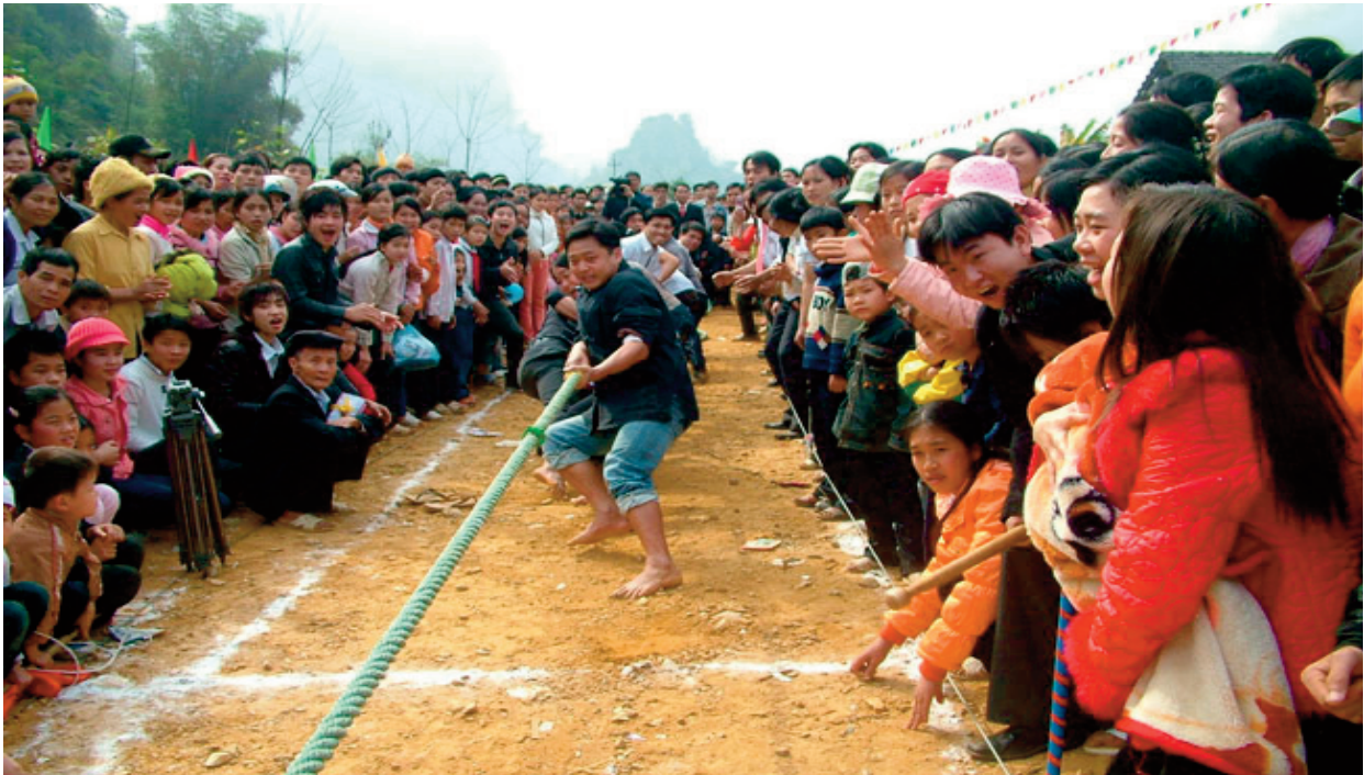
Trong các lễ hội dân gian truyền thống, các môn thể thao dân tộc các trò chơi dân gian luôn nhận được sự hưởng ứng rất nhiệt tình của đông đảo người dân

vấn đề cấp thiết và có ý nghĩa thực tiễn.